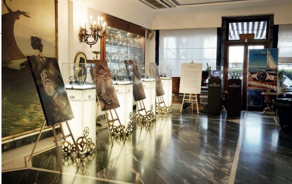
L'esposizione del Museo Philip Watch presso il Reale Yacht Club Canottieri Savoia di Napoli, il 9 giugno scorso.