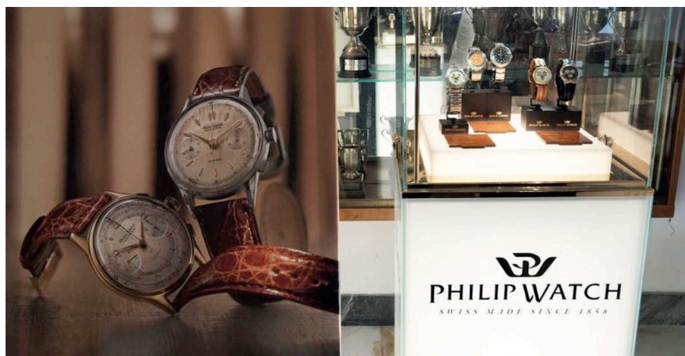
Tra i pezzi del Museo esposti a Napoli, anche due esemplari Caribbean, importanti punti di riferimento nella storia dell'orologeria subacquea.